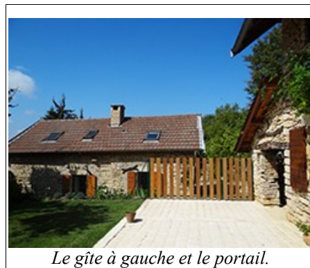
Le gîte à gauche et le portail.